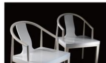
“通行”系列椅椅 材质:竹/实木

“通行”系列椅椅 为郦波的家产品,因为不是为固定场所而做,所以没有太多的功利性和装饰的束缚,充满了设计者自己的思想和创意。加味“通行”系列椅椅,以竹子这种代表中国的材料去表达“人与自然和谐共处”的中国传统思想,同时符合环保、可再生的设计标准。郦波希望通过自己的设计行为,呼吁同行和消费者去关注绿色设计。