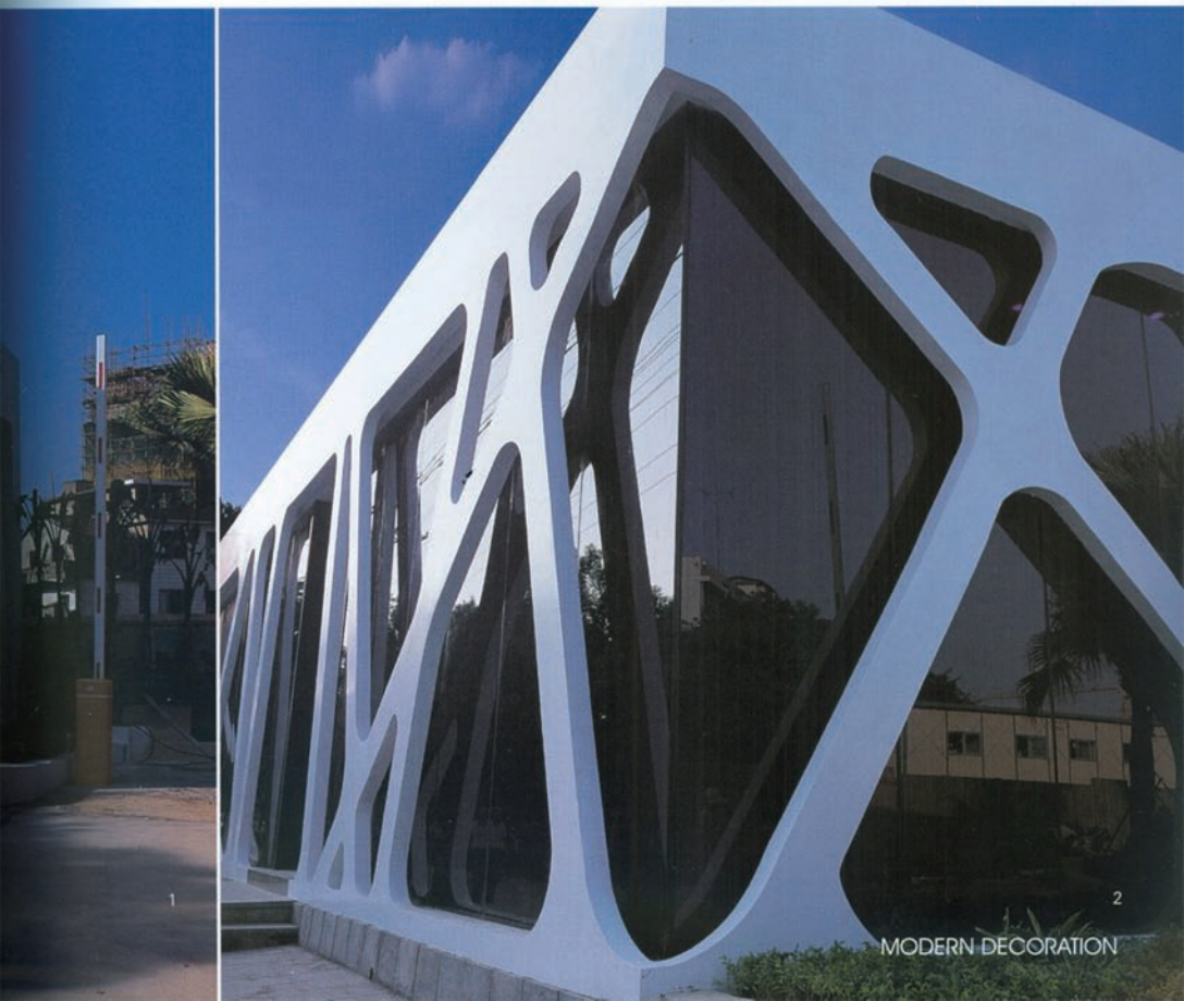
图1、2 整个建筑外观采用白色GRG造型支架结构，内衬蓝色玻璃，具有独特的视觉通透感。