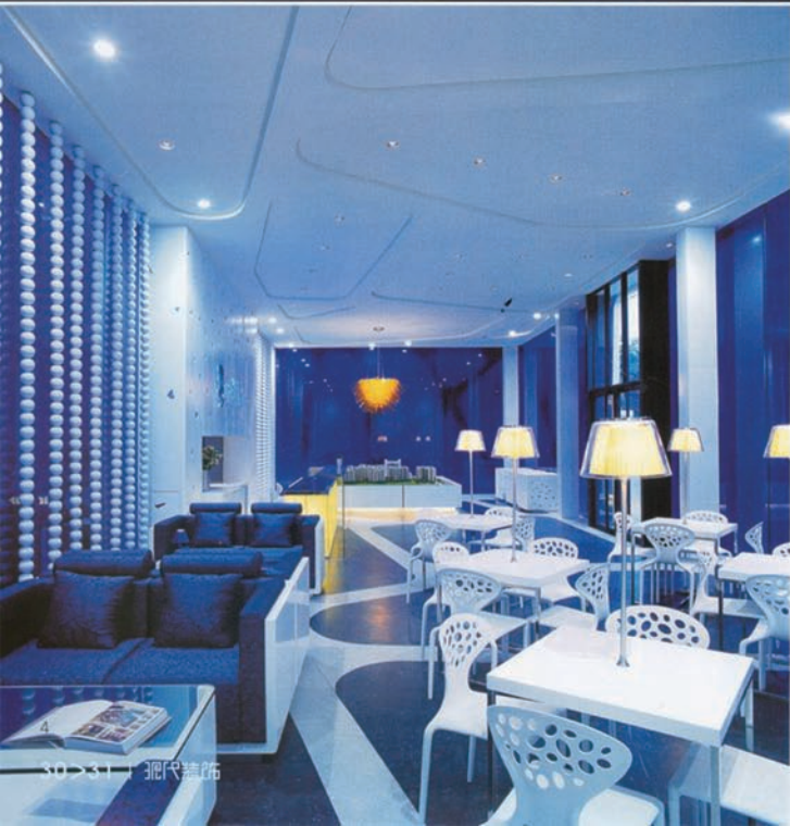
图3 室内延续建筑外观的深蓝，简洁的白色灯具阵列排开，给狭小的空间增添了一条明朗的色带，与天花相映，使整个空间变得宽敞。

由于售楼处销售期处于夏季，考虑到购买者的心理感受，“透”的含义油然而生。在这样的季节里，“透”也更容易把客户留在这个空间中。用绿色材料GRG搭建的造型外观内衬蓝色玻璃，使整个建筑独一无二的屹立在人们的视线中！入室后更会发现设计的心思，白和蓝的结合充斥着每一个细节，而一抹芥末黄色又悄悄地点缀着这个稍显宁静的空间，使形体和界面立刻为之丰富。室内地面通过深浅不一的颜色变化勾勒出的图案，同时反射在相同位置的天花上，空间的层次在这里也得到体现。